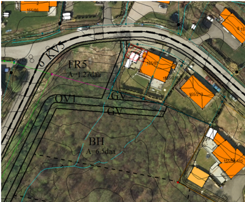
Planforslaget vist med ortofoto av området som bakgrunn.

Arealet ligger i sterkt skrånende terreng ned mot planlagte barnehage. Overvann fra veiene ledes ut i 2 store overvannsledninger på begge sider av området/tomta (se bilde) og videre til bekken. Disse overvannsledningene vil kreve båndleggelse av et betydelig areal hvis den skal brukes til bolig. Videre har man byggegrense fra vei på 4 m, noe som også reduserer tilgjengelig areal. Tomta er i dag planert ut i høyde med er vei. Det er lite trolig at massene i oppfyllingen er gode nok til å fundamentere hus på. Skal arealet tilby som tomt må kommunen sjekke fyllingen og muligens masseutskifte.