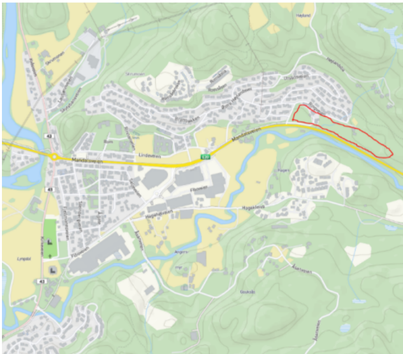
Oversiktskart. Rød ring angir omtrentlig planområdet.

Planen er en utvidelse/forlengelse av boligfeltet i Romsbogen og består av arealene mellom E39 og Ringveien i nord og Romsbogveien i vest. I øst er plangrensen som avsatt i kommuneplanen.