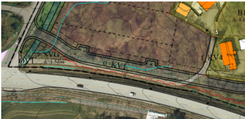
Planforslaget med flyfoto som bakgrunn.

Avstanden mellom vegkant E39 og regulert adkomstvei er min. 10 meter. Dagens adkomstvei er nærmere.